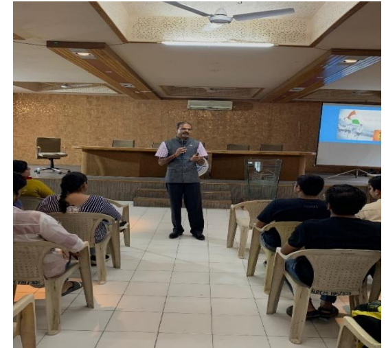
Seminar (Essential of Life Management) 03-08-2024