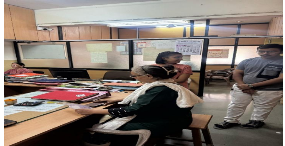
Visit to School of Deaf and Dumb children 02-04-2025