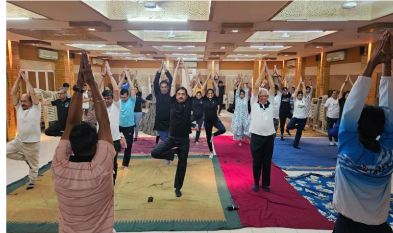
International Yoga Day 21-06-2024