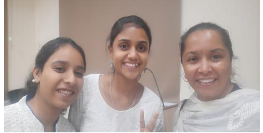
Poshan Maah 12-09-2024