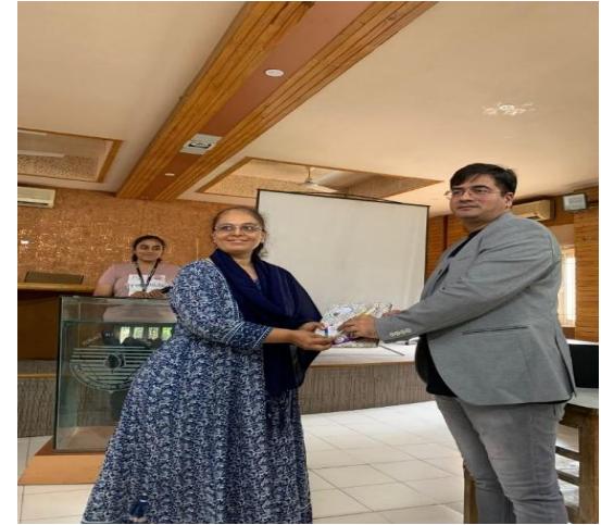
Seminar (self-Learning and Education) 31-07-2024