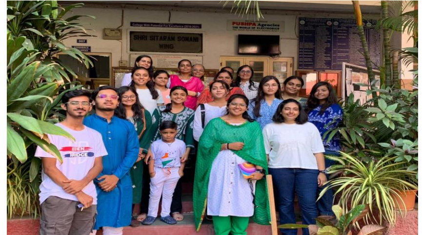
Independence Day celebration at college 15-08-2024