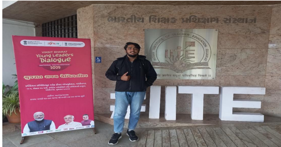
Viksit Bharat power point Presentation 28-12-2024