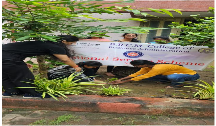
Tree Plantation 04-07-2024