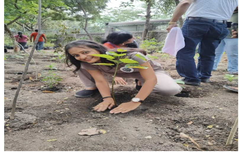
World Environment Day Surat Van: Urban forest initiative 17-06-2024